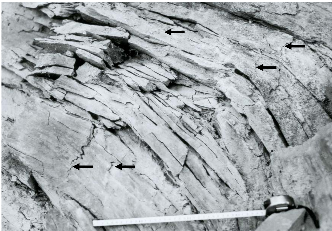
写真-1 徳島県眉山の緑色片岩中に発生した谷側への曲げ褶曲 矢印は引張り割れ目の位置を示す。